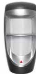
Détecteur numérique performant à optiques doubles pour l'extérieur (véritable insensibilité aux animaux au poids inférieur à 40 kg/90 lb) (MG-PMD85) Portée : 35 m (115 pi)*

* portée représentative dans un environnement résidentiel