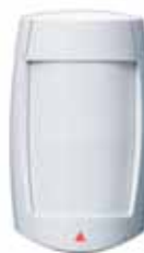
Détecteur numérique performant à optiques doubles (véritable insensibilité aux animaux au poids inférieur à 40 kg/90 lb) (MG-PMD75) Portée : 35 m (115 pi)*