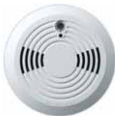
Détecteur de fumée (SD738) Portée : 30 m (100 pi)* Fabriqué par EVERdaq (Taïwan)†