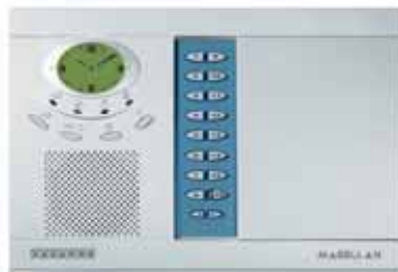
Système sans fil tout-en-un (MG-6060)