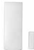
Contact de porte à longue portée (MG-DCT1) Portée : 35 m (115 pi)*